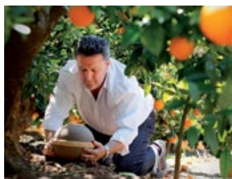
... in einem Orangenhain oder Pinienwald (in Valencia/Spanien mit mediterranem Klima)