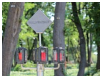
... in einem Waldfriedhof (am Wiener Zentralfriedhof)

Jeder Mensch ist einzigartig. Genauso individuell sollten auch die Möglichkeiten für die letzte Reise sein: