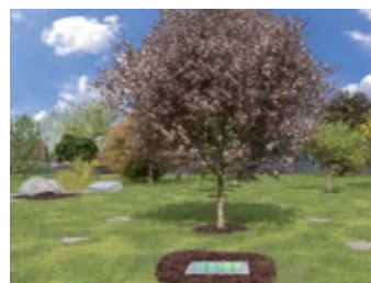
... bei einem Familien-/Freundschaftsbaum (am Friedhof Stammersdorf Zentral)