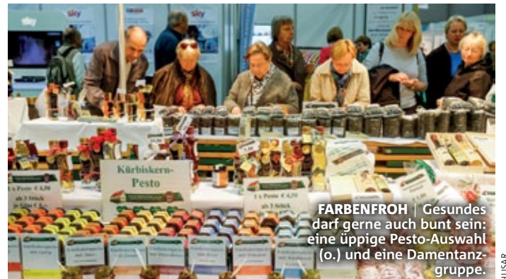
FARBENFROH | Gesundes darf gerne auch bunt sein: eine üppige Pesto-Auswahl (o.) und eine Damentanzgruppe.