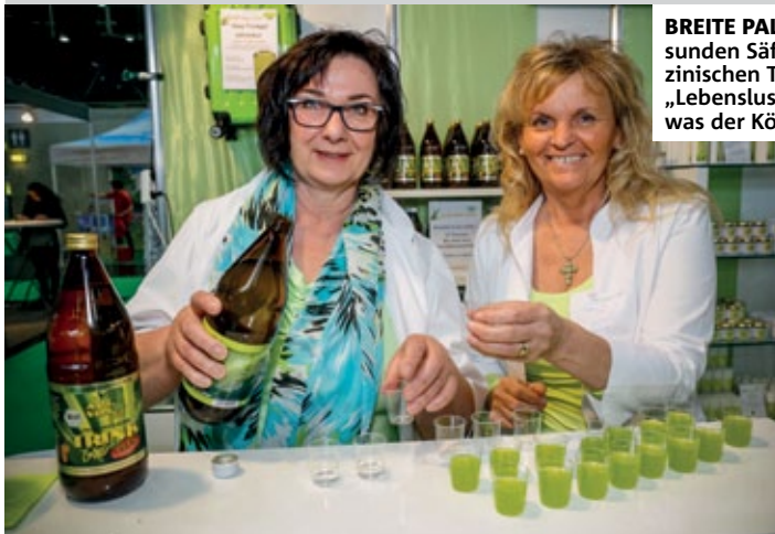
BREITE PALETTE | Von gesunden Säften bis zu medizinischen Tests ist auf der „Lebenslust“ alles vertreten, was der Körper braucht.