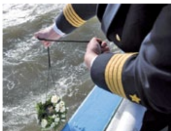
... mit einer Seebestattung (auf der Donau)